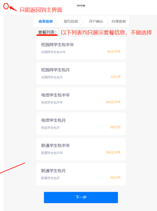
用户界面-预约开户-查看套餐